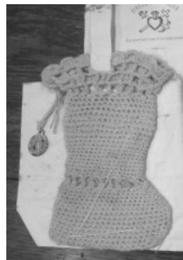
Imagen 3. Zapatito dejado por sus padres a su hijo cuando lo dejaron en el Torno como señal. 1895. AGN.

Veamos las prácticas de la caridad a través de los deposítos de niños y a través del ejercicio de la adopción.