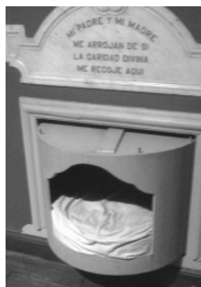
Imagen 1. Torno utilizado en el Asilo de Expósitos y Huérfanos sin identificar la fecha. Museo Histórico Nacional. Casa de Rivera.

El tercer objetivo, y no menos importante, es la conceptualización histórica de algunos términos utilizados en los documentos y necesarios para entender, entre otras cosas, preconceptos sociales hoy día naturalizados; las necesidades y expectativas de los padres que buscaban adoptar niños, y los objetivos y proyectos perseguidos por el primer orfanato montevideano.